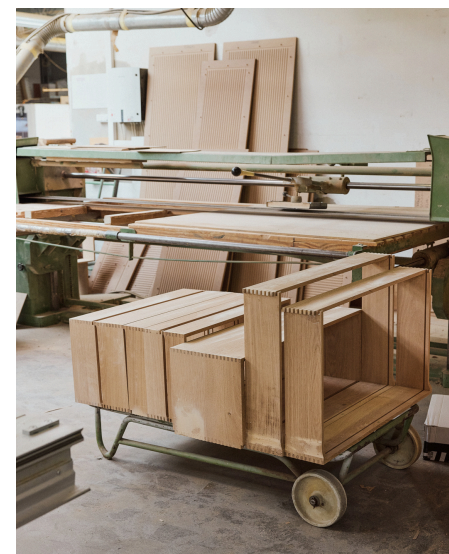
En defineret retning

Signaturkolektionen tager udgangspunkt i tre designudtryk: Hoelgaard, Layer og Solid. Hvert udtryk repræsenterer en distinkt designlogik forankret i proportion, materiale og konstruktion.